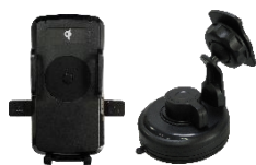
充電ホルダー＋吸引マウント×1